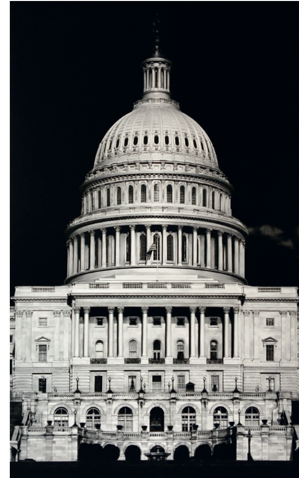
Robert Longo, geb. 1953 Capitol, 2017 © Robert Longo, VG Bild-Kunst, Bonn 2017 Ditone-Print 56 x 61 cm Courtesy Galerie Fluegel-Roncak, Nürnberg